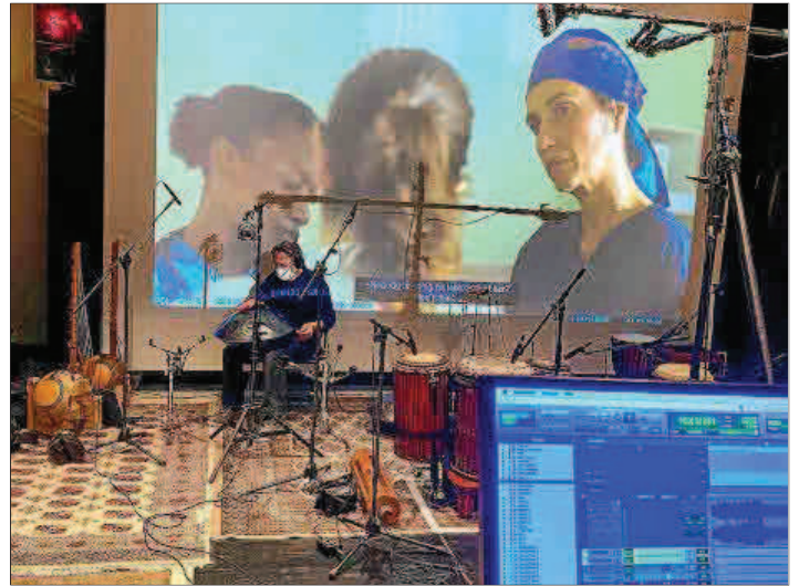
Un momento de la grabación de 'Pan de limón con semillas de amapola'.

De esta forma, Joan Valent regresa al mundillo cinematográfico y de bandas sonoras tras una década, entre 2010 y 2017, en la que trabajó en hasta cerca de una veintena de producciones, logrando una nominación a los Goya 2014 por Las brujas de Zugarramurdi , de Álex de la Iglesia, con quien también trabajó en Mi gran noche o El Bar .