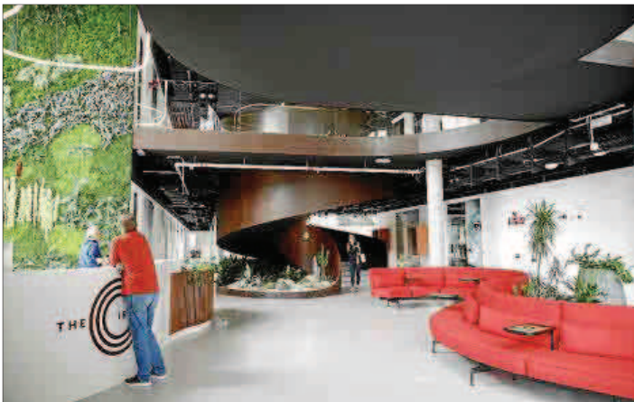
Imagen del vestíbulo de The Circle, en Son Bugadelles.

Centros • La empresa liderada por Drew Aaron se consolida en la Isla con un ritmo frenético de nuevos proyectos tanto en la capital como en la Part Forana • A la reciente inauguración de la Soho Gallery se suman estos nuevos espacios y varios más