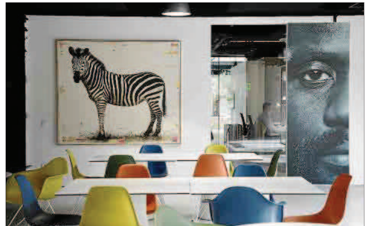
Las piezas se adaptan perfectamente al espíritu del espacio en el que se colocan.